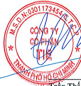
Trần Thế Vinh Chủ tịch Hội đồng quản trị