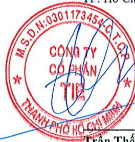
Trần Thế Vinh Chủ tịch Hội đồng quản trị